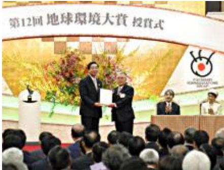
写真 1 第 12 回地球環境大賞授賞式