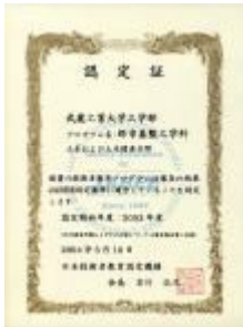
写真 2 JABEE 認定証